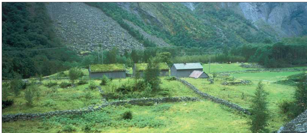
Det ligg to bruk i tunet på Måbo.

MÅBØ er den øvste garden i Måbødalen. Denne tronge og bratte fjelldalen har frå uminnelege tider vore ein av vegane frå fjordbygdene opp mot fjellvidda. Vi veit ikkje sikkert kva namnet Måbø tyder. Kanskje har det sitt opphav i eit gammalnorsk mannstilmann Måvi, av fuglenamnet mår (måke). Sisteledet bø, tyder gard. I dag gjev Måbø oss eit fortetta nærbilete av naturalbushaldet: den vesle garden, med rydningsrøysar, steingardar og geil som leidde buskapen inn i tunet, ved foten av den store fjellvidda.