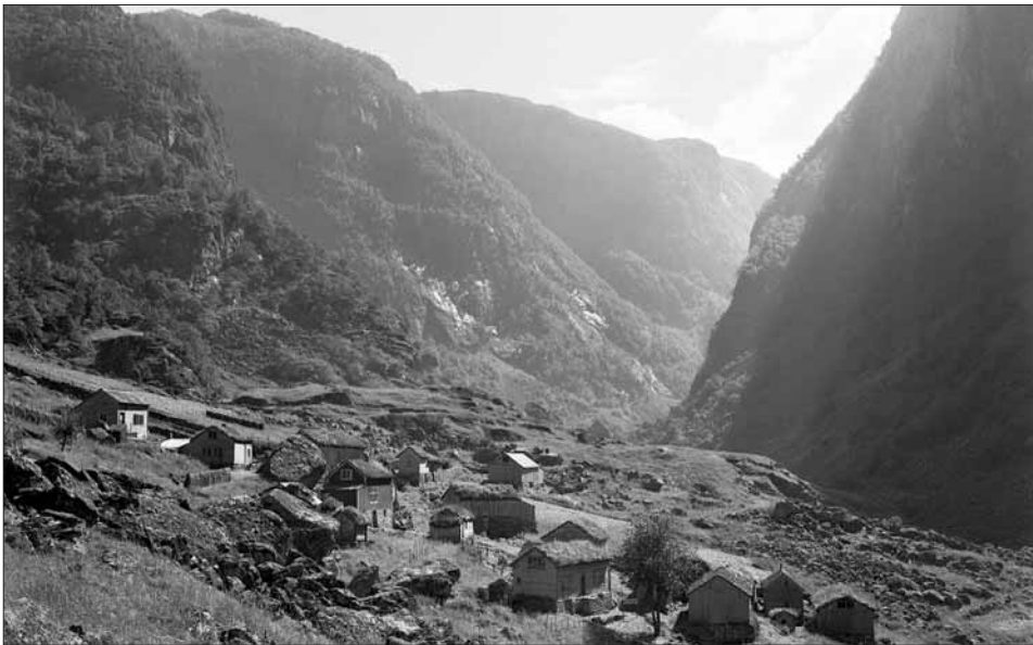
Klyngjetunet i Hjølmodalen tidleg i dette hundreåret.

I den bratte dalsida i HJØLMODALEN, ein liten sidedal frå Øvre Eidfjord som har vore ein sentral oppgang til Hardangervidda, ligg framleis det gamle fellestunet samla. Tunet står tomt idag; nokre av busa er i bruk sommarstid, men graset veks kring alle nover.