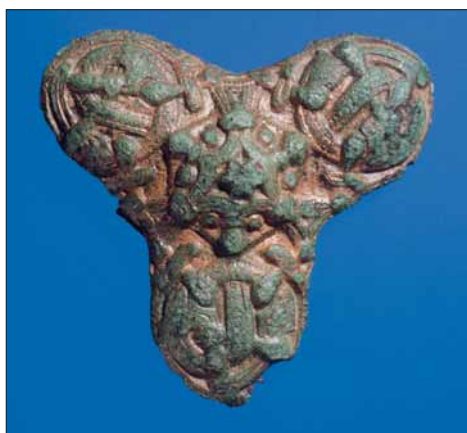
Treflika spenne frå 900-talet.

Eidfjord har slike store gravfelt. Også på Lægreid har det vore mange haugar, og i Øvre Eidfjord finst fleire større felt. Anten må gravskikken ha vore annleis her enn i andre bygder, slik at dei fleste døde, og ikkje berre nokre få, vart heidra med haug eller røys. Elles så har folkesetnaden vore svært stor. Granskarar har ofte drøfta dette, utan å finna noko sikkert svar. □