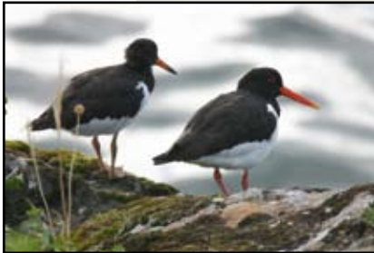
Tjeld/ Oystercatcher

I tilknytning til dette området er det sett opp ei observasjonshytte der ein kan studera fuglelivet i fred og ro. Fjellet byr på ulike artar som trivst i denne barske biotopen. Der vil ein finne ro som berre vert avbroten av heiloen sin einsame låt.