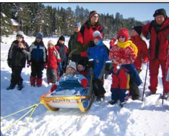
Drevtjørn Ski- & Tursenter